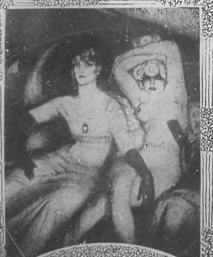
Le damer de la mer.

potencial, español de Guira de Metena, no tiene más que treinta y seis años. Sus primeros éxitos han sido casi laureles de adolescencia; al llegarle hoy la "plena eta", para la cual pedía el Dante suma perfección, hállase internacionalmente célebre en la tierra de las celebridades. París acaba de darle su espaldarazo soberano.