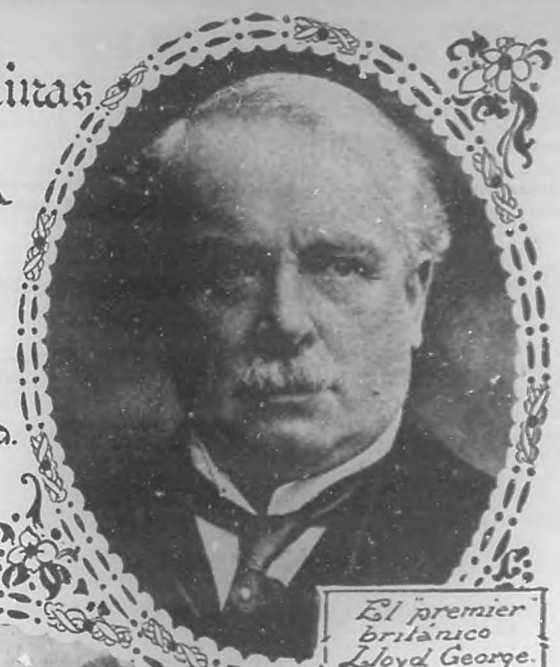
El premier británico Lloyd George.