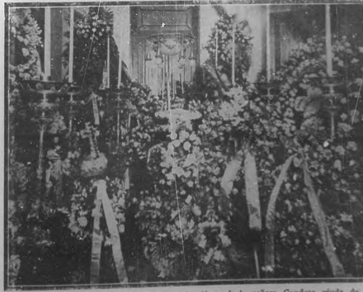
Regia capilla ardiente en que fué expuesto el cadáver de la señora Condesa viuda de Rivero.