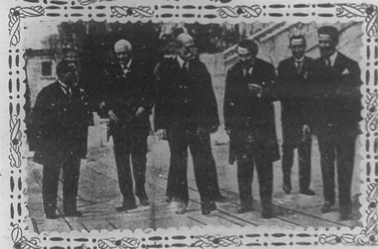
En el óvalo: Los cinco jefes de los aliados durante la guerra mundial.—Abajo: Las grandes figuras de la Conferencia del Desarme.

La conferencia del desarme universal, que actualmente se celebra en Washington, está hecha al parecer, como todas las otras conferencias que con fines humanitarios se han venido celebrando en todos los países civilizados, casi desde que el hombre fue todopoderoso y señor de vidas y haciendas.