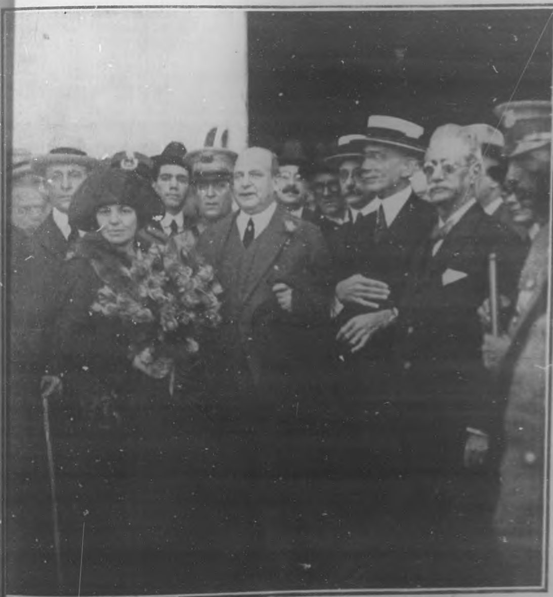
Momento en que este ilustre americano, grande y buen amigo de Cuba, salía, acompañado de su esposa, de la estación del Arsenal. Entre las personas que rodean a Mr. Rubens aparece el coronel Charles Hernández, uno de sus mejores y más estimados amigos.