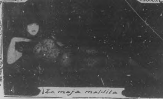
La maja malvita