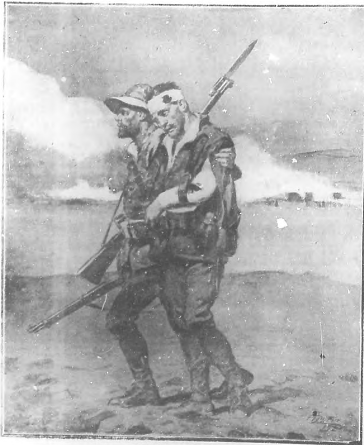
HEROES ANONIMOS Dibujo de Agustín