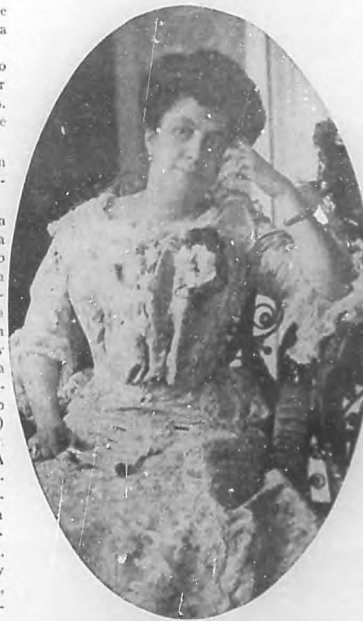
LA CONDESA VIUDA DEL RIVERO Ilustre dama, altamente apreciada en nuestra sociedad, de cuyo fallecimiento nos ocupamos en esta crónica.