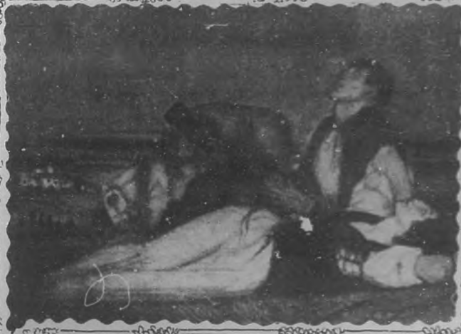
Vers les étoiles

En cuanto a los tipos de las figuras, ¡qué perversión fácil, qué sugere-